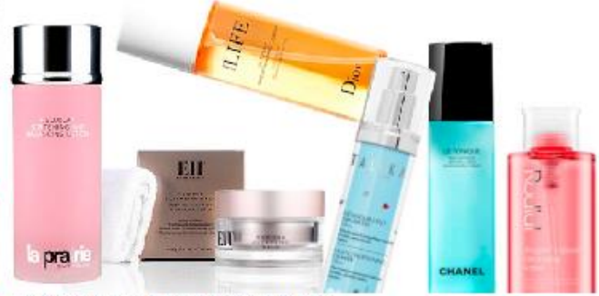
Productos desmaquillantes