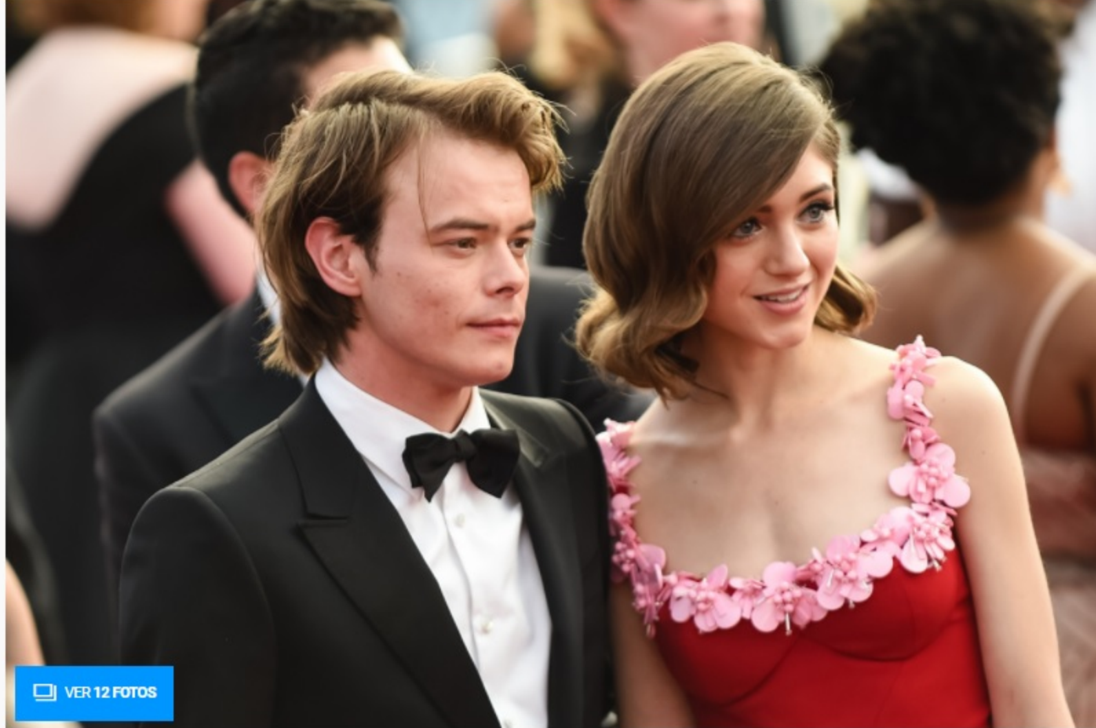
Fine de ella y no te pasarán stranger things.