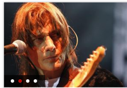
Antonio Vega en 5 canciones