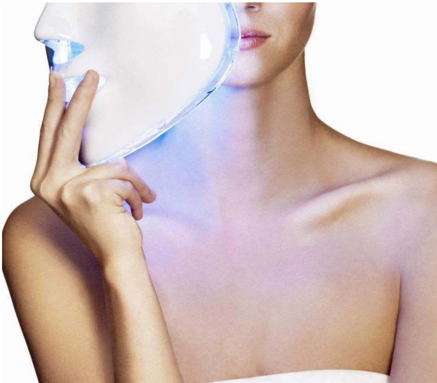
Máscara LED. Korean Mask, de Unicskin. Antonio Terrón